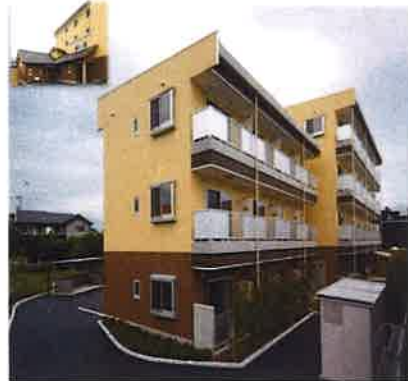
シニア南俣ハウス