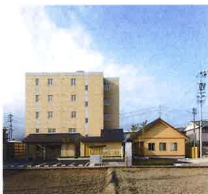
シニアいなばハウス