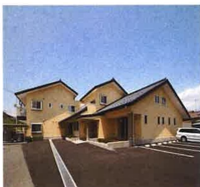
シニアたかだハウス