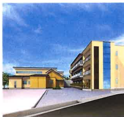
シニア若里ハウス