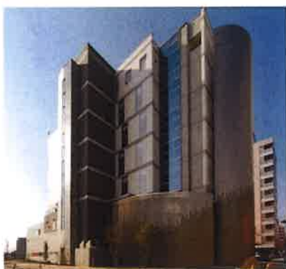
シニア東口ハウス