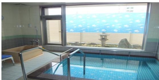
坪庭が見渡せる 浴室