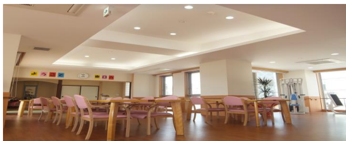
天井が高く 開放感がある 明るい食堂