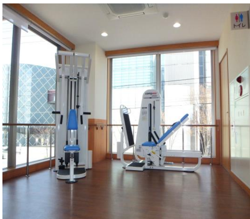
運動不足解消に 充実した運動機器