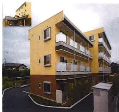
シニア南俣ハウス