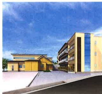
シニア若里ハウス