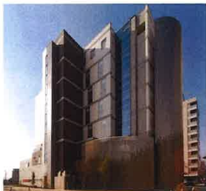
シニア東口ハウス