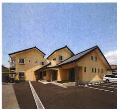
シニアたかだハウス