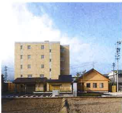
シニアいなばハウス