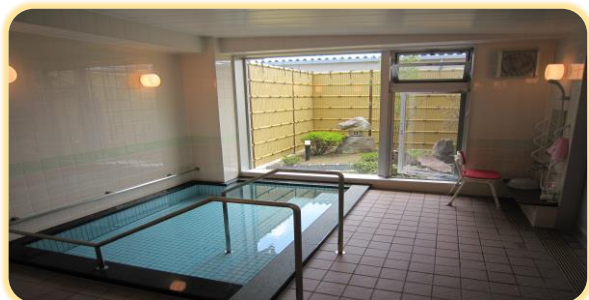
坪庭が見渡せる浴室