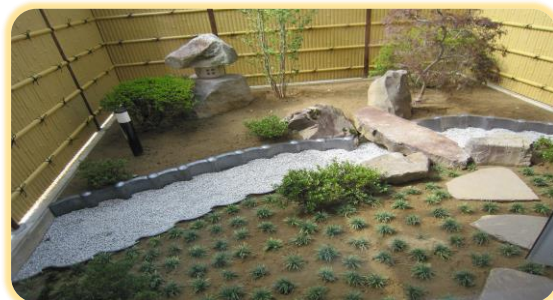
四季折々の坪庭スペース